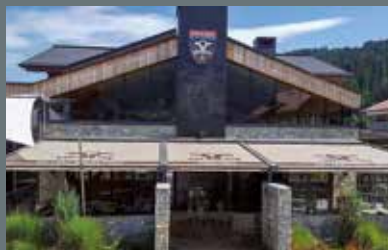
Restaurant Paularei, Flachau (A)

www.laimermarkisen.com www.facebook.com/laimermarkisen