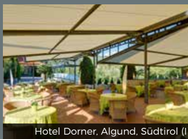
Hotel Dorner, Algund, Südtirol (I)