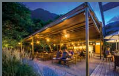
Andreas Hofer Bräu, Südtirol (I)